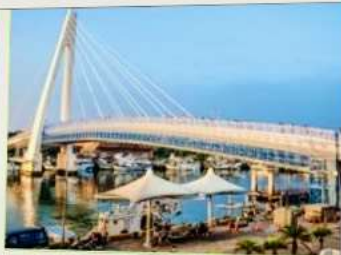
สะพานคู่รักตั้นส่วย