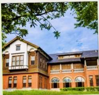
พิพิธภัณฑ์น้ำพุร้อนเป่ย์โถว