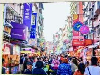
ถนนโบราณตื่นสุ่ย