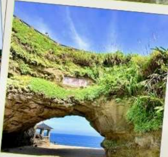
ถ้ำซือเหมิน