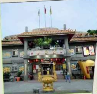
วัดจินชาน (โซคลาก)