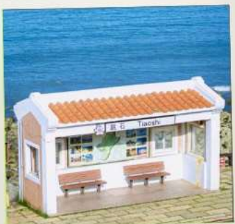
Tiaoshi Bus Station