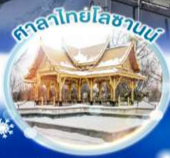
ศาลาไทยโบราณ