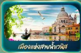
เมืองแห่งสายน้ำเวนิส

จุดบรรจบความอลังการของธรรมชาติ Dolomites และ ทะเลสาบมิซูรีน่า ชมน้ำสีเทอร์ควอยซ์ ทะเลสาบเบริส สูดโรแมนติกเมืองแห่งสายน้ำเวนิส ห้างพลาซ่า มหาวิหารดูโอโมแห่งมิลาน โรมัน ฮาร์น่า บ้านของจูเลียต เทย์ลอร์เชอร์รี่ ชมสิงโตหินแกะสลัก เดินเล่นสะพานไม้อาเปลา อินส์บรุค ย้อนอดีตกับเฮาเซนด็อนน์ หลังคาทองคำ ซ้อปจูจ Outlet