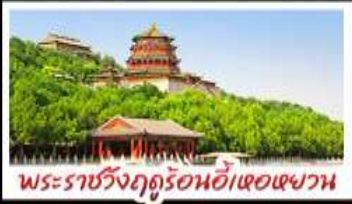
พระราชวังฤดูร้อนอี้เหอหยวน

ท่าแพงเมืองจีนด่านจวิงกวน - พระราชวังฤดูร้อนอี้เหอหยวน สวนจึงอัน - วัดลามะ - โม่หลงร้านช้อปปิ้ง - โรงแรม 4 ดาว มื้อพิเศษ เปิดบิกกิ้ง สุกี่นงโกนา MICHELIN GUIDE ร้าน TAO TAO JU