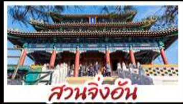
สวนจึงอัน