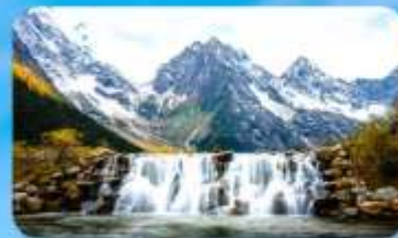
อุทยานปี้ผิงโกว