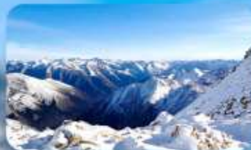
อุทยานคำกู่ปิงชว่น