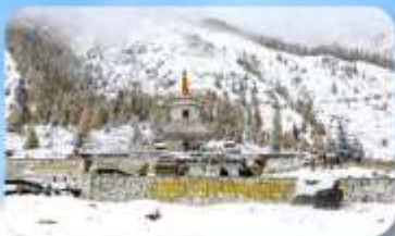
อุทยานกูเวาสีครุณี