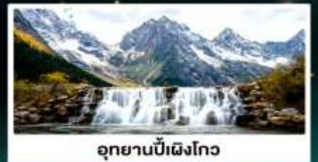
อุทยานปี้เฉิงโกว