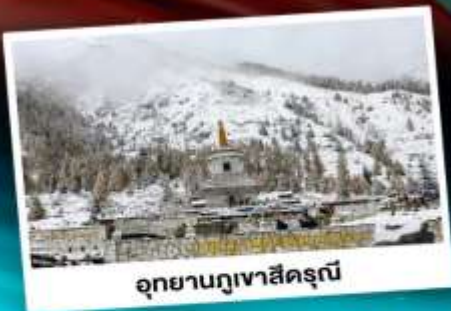
อุทยานกุเวาสีดรุณี