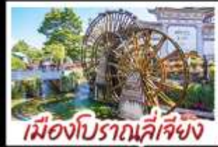
เมืองโบราณสี่เจียง

ถนนท่าคุณมิ่ง - ถนนสายดอกศรีตรัง หุบเขาพระจันทร์สีน้ำเงิน - อุทยานมิ่งกรหยก เมืองโบราณสี่เจียง - ทะเลสาบเอ๋อไห่ สวนน้ำตกคุณมิ่ง - รถมอเตอร์ไซด์