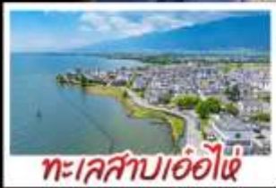
ทะเลสาบเอ๋อไห่