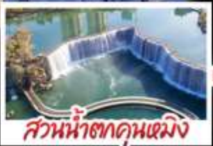
สวนน้ำตกคุณมิ่ง