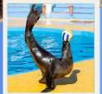
POLAR OCEAN PARK