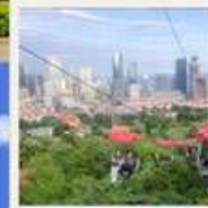
กระเช้าชมเมือง