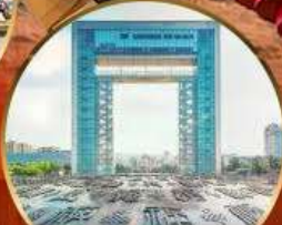
ประตูแห่งความสุข