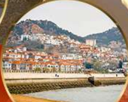
ซาจื่อไห่