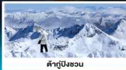
ต้ากู่ปิงชว่น