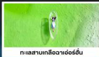
ทะเลสาบเกลือฉาเอ๋อร์อัน