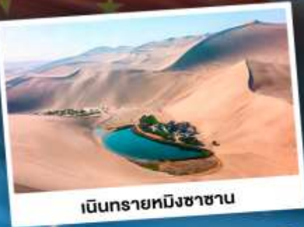
เนินทรายหมิงซาซาน