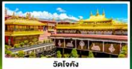
วัดโจกัง