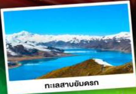
ทะเลสาบยี่นครก