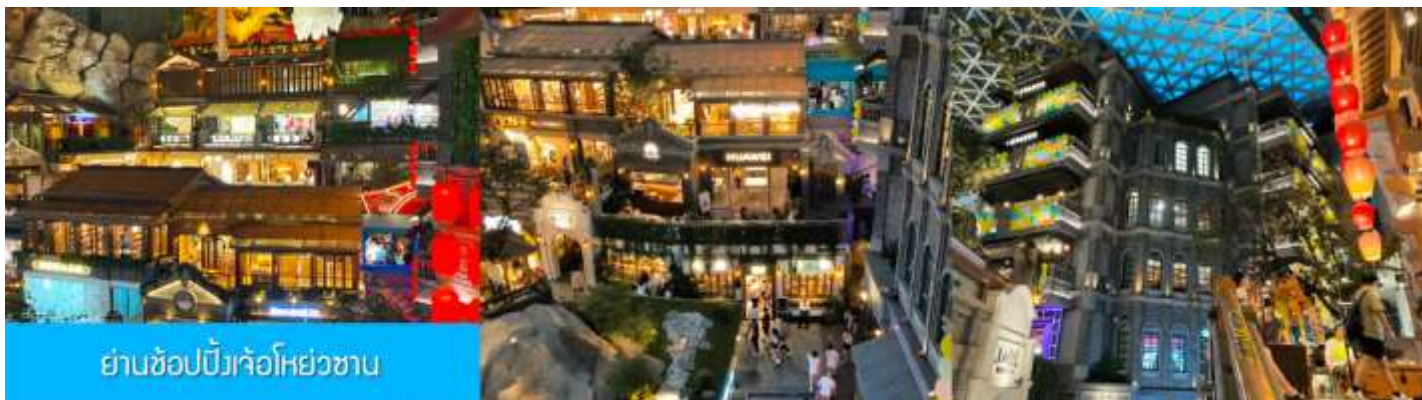
ย่านช้อปปิ้งเก๋โอห่วยชวน

นำท่านเที่ยวชม ย่านช้อปปิ้งเจ้อโอห่วยชวน 这有山 แหล่งช้อปปิ้งชั้นชื้อที่ผสมผสานระหว่างสถานที่ท่องเที่ยว และแหล่งรวมร้านค้า และร้านอาหารฟาสต์ฟู้ด อาหารพื้นเมืองร่วมสมัย ภายใต้คอนเซ็ปต์ แหล่งช้อปปิ้งบนภูเขา และบนภูเขามีแหล่งช้อปปิ้ง เป็นจุดเช็คอินยอดนิยมที่เปิดให้คนพื้นที่และนักท่องเที่ยวเข้าชมตั้งแต่ปี ค.ศ. 2019