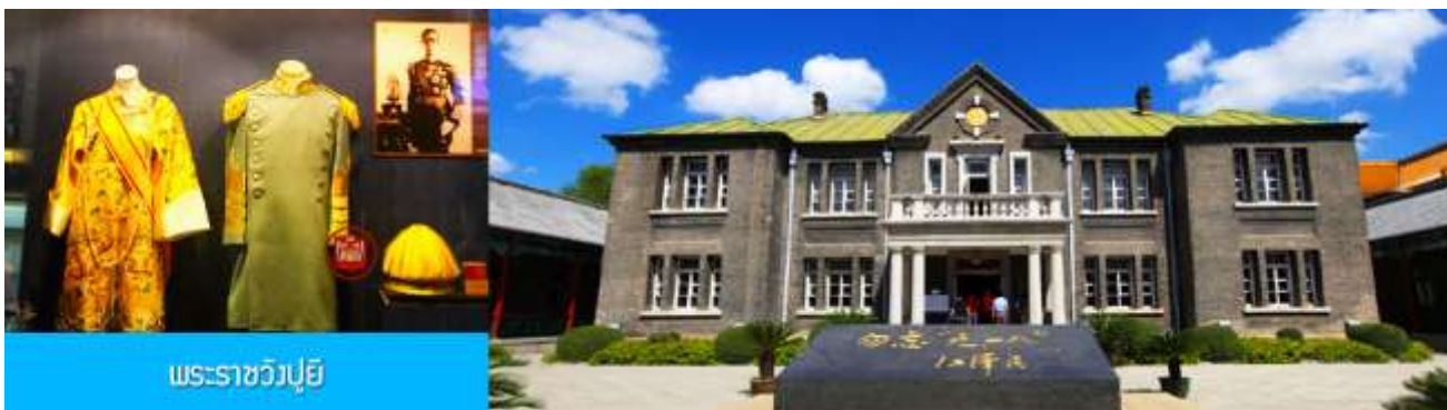
พระราชวังปู้ยี้

รับประทานอาหารเช้า ณ ห้องอาหารของโรงแรม (7)