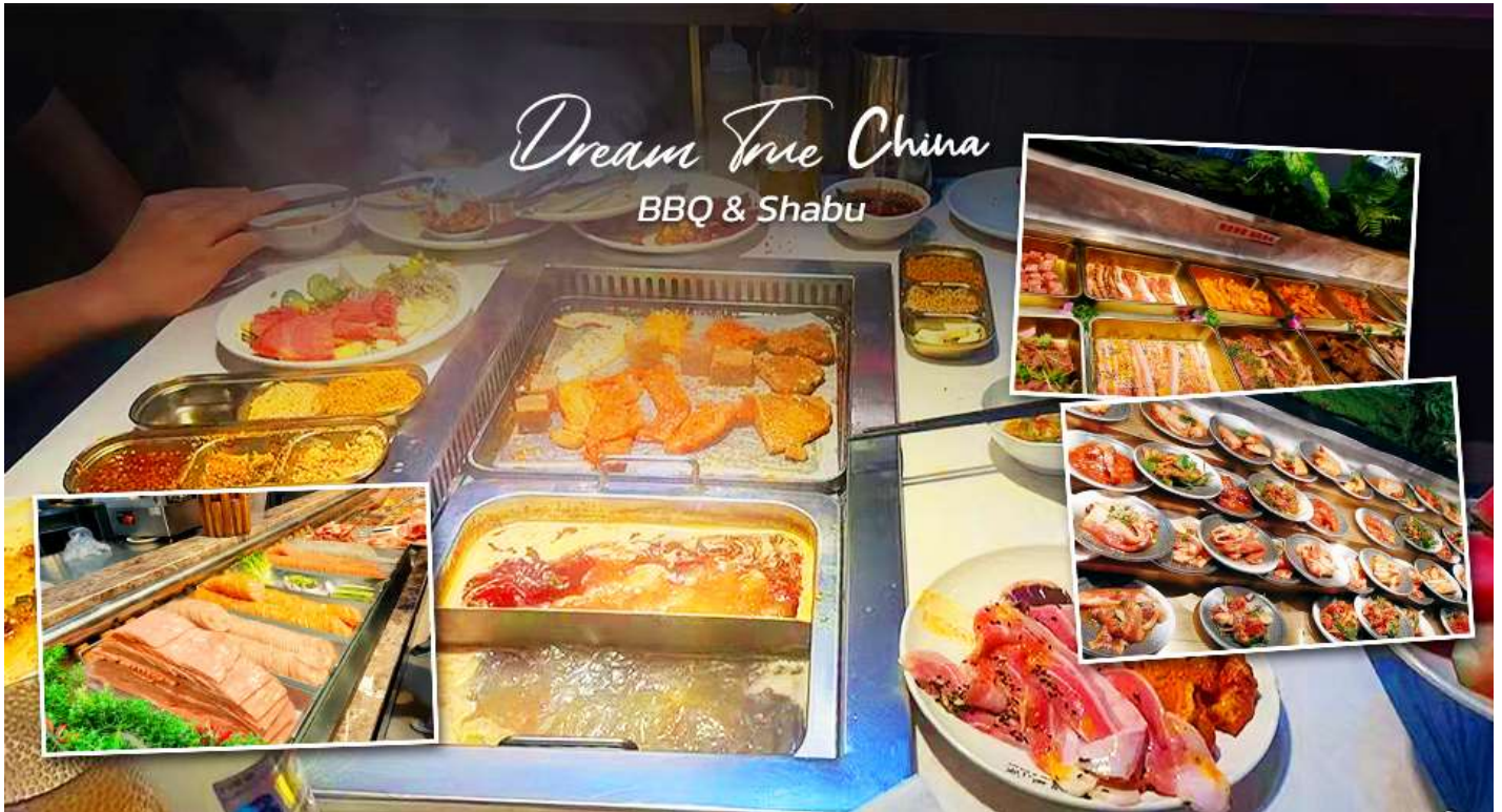
ค่ำ ๑๐ รับประทานอาหารค่ำ ณ ภัตตาคาร : เมมูพิเศษ!! บุฟเฟ่ต์ BBQ & สุกี้ชาบู