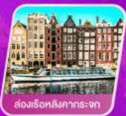
ล่องเรือหลังการระงก