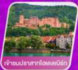
เจ้าชปนปราสาทไฮคสเบิร์ก

เที่ยวเทศกาลดอกไม้เคอเคนฮอฟ ชมแควินอาลซัส หมู่บ้านสวยที่สุดในฝรั่งเศส เยือนเมืองมรดกโลก