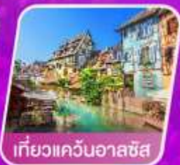
เที่ยวแควินอาลซัส