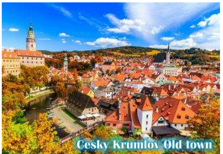
Cesky Krumlov Old town

บ่าย นำท่านเดินทางสู่ “เมืองเชสกี้ คุมลอฟ (เมืองมรดกโลก)” เป็นเมืองขนาดเล็กในภูมิภาคโบฮีเมียใต้ของ สาธารณรัฐเช็กมีชื่อเสียงจากสถาปัตยกรรม และศิลปะของเขตเมืองเก่าและปราสาทคุ มลอฟ ที่ยังคงมีเสน่ห์เหมือนอยู่ในเทพนิยายมา จนถึงทุกวันนี้ และน่าจะเป็นเมืองที่สวยงามที่สุดใน สาธารณรัฐเช็ก, เชสกี้ คุมลอฟได้รับการจัด อันดับให้อยู่ในสิบเมืองที่สวยงามที่สุดในโลก เป็น หนึ่งในสถานที่ที่สวยงามที่สุดและไม่ควรพลาด ในการเดินทางไปสาธารณรัฐเช็ก เดินเล่นไปบน ถนนในยุคกลาง ปราสาทสไตล์บาโรกที่ไม่บุบ สลาย และแม่น้ำที่คดเคี้ยว เมืองเก่าที่งดงามแห่งนี้ได้รับการอนุรักษ์ไว้อย่างดีจากอดีตและการทิ้งระเบิดใน สงครามโลกครั้งที่ 2 ทั้งหมดทำให้เมืองที่มีทิวทัศน์แห่งนี้รู้สึกเหมือนอยู่ในเทพนิยายจากยุคกลางสู่ความเป็นจริง