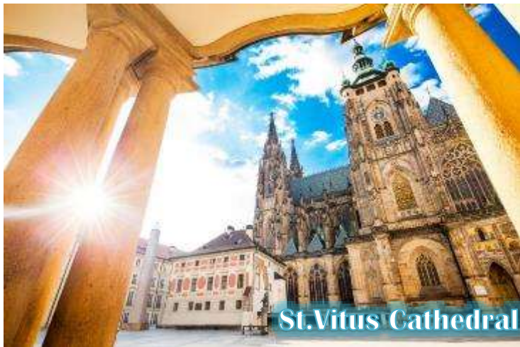
St. Vitus Cathedral