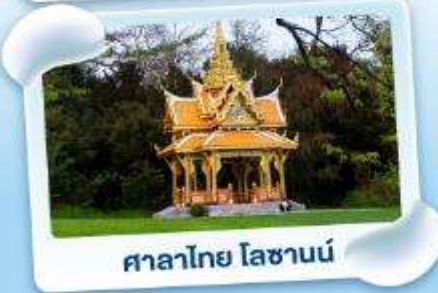
ศาลาไทย ไหลซานน์