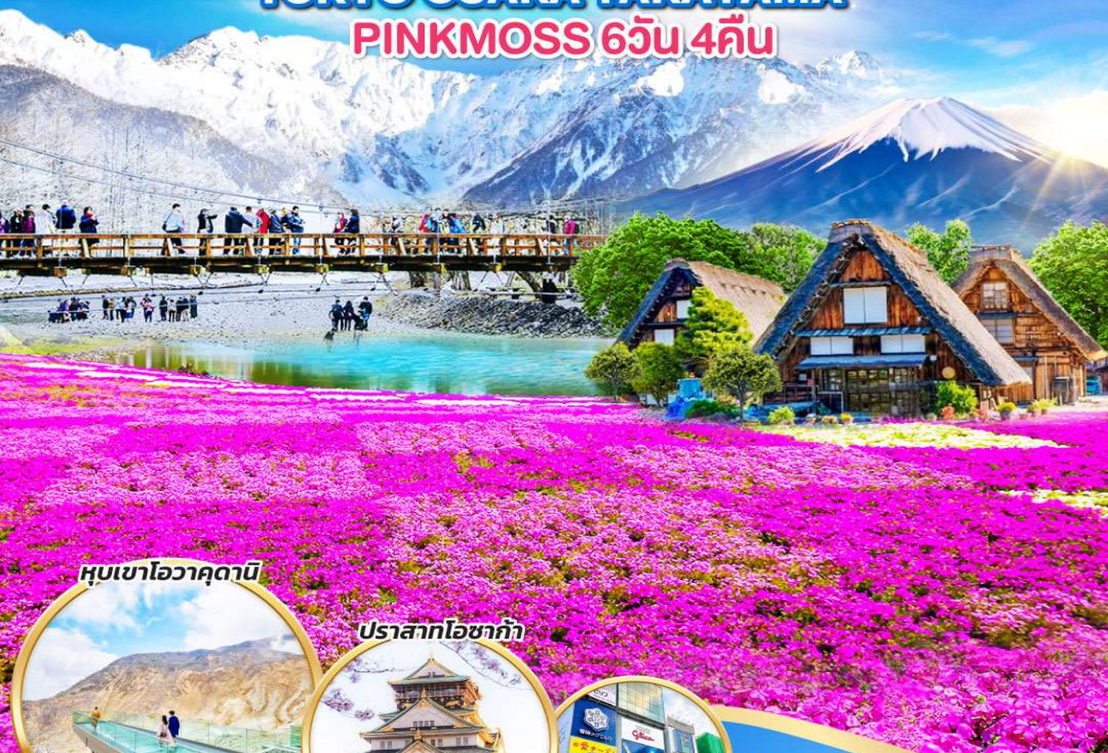
หุบเขาโอวาคุดานิ