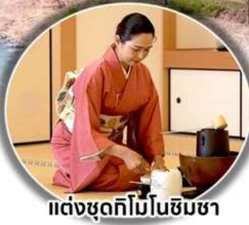
แต่งชุดกิโมโนชิมชา