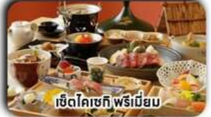
เซตโคเชกิ พรีเมียม