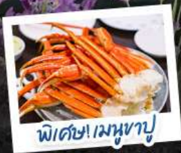
พิเศษ! เมฆงาปู