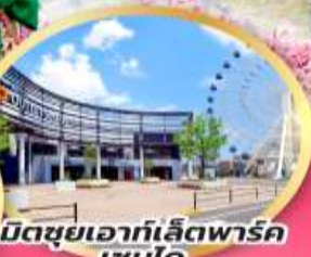
มิตซูเอากะเล็ดพาร์ค เซนได

จุดชมซากุระพันทัน ฮิโตะเมะ เซ็มบง ซากุระ