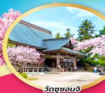
วัดชูซอนจิ