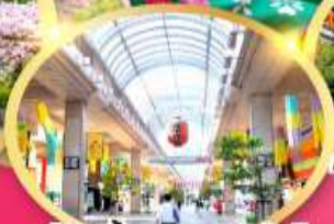
ช้อปปิ้ง ถนนอิชิบังโจ