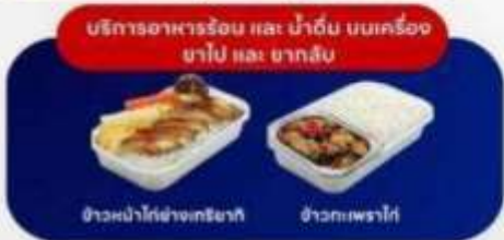
ข้าวหน้าไก่ย่างเกาหลี