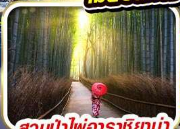
สวนป่าไฟอาราชิยาม่า