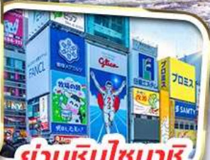
ย่านชินโซบาชิ