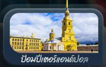
ป้อมปืนอาร์ทillery

highlight สองเมืองไฮไลท์ของรัสเซียที่ไม่ควรพลาด! ตื่นตาตื่นใจกับมหาวิหารเซนต์บาซิล ชมความยิ่งใหญ่ของจัตุรัสแดง สัมผัสอดีตที่พระราชวังเครมลิน ชมความงามของสถานีรถไฟใต้ดินมอสโก ชาร์กอร์ส โบสถ์ไอสิกรีนดี เป็นเขาสเปร์โรวให้คุณได้สัมผัส ชมความงามพระราชวังฤดูหนาว พิพิธภัณฑ์ฮอร์มิงทง ป้อมปืนอาร์ทillery และมหาวิหารเซนต์ไอแซค