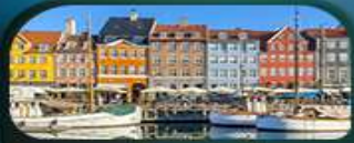
ย่านนูฮาวน์