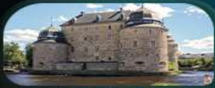
ปราสาทโอเรโบ