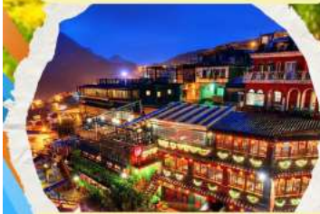
หมู่บ้านโบราณฉิวเฟิง