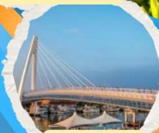
สะพานต๋ันฮู่ย