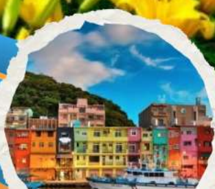
ท่าเรือเจิ้งปิง