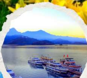
ทะเลสาบสุริยขึ้นจินทง