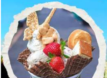
ร้านไอศกรีมมิยาฮาระ