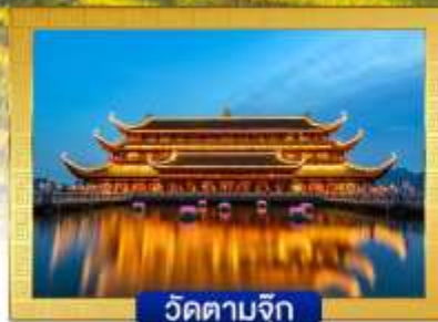
วัดตามจิก