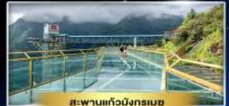
สะพานแก้วมิงทรมบ