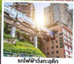
รถไฟฟ้าวงก-ลุดคิก