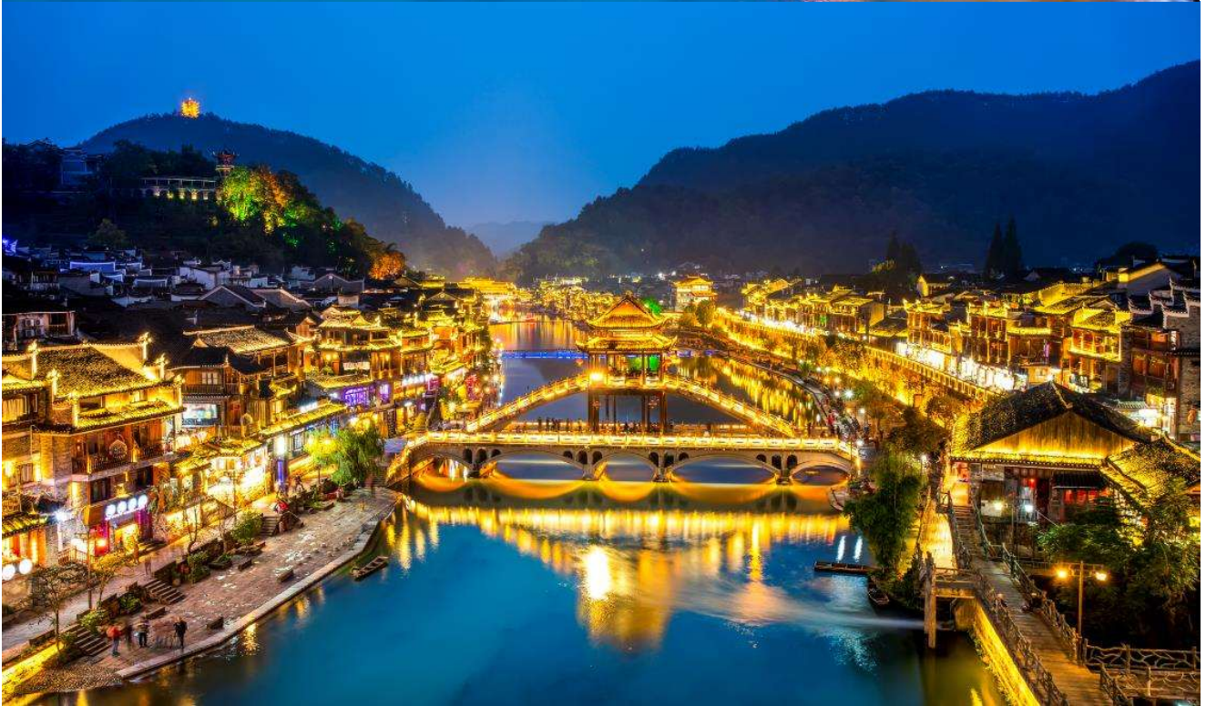
T2G-CSX14FD ฉางซา จางเจียเจี๋ย ฟุหรงเจิ้น เฟิ่งหวง สะพานแก้ว ชมโชนางจิ่งจอกขาว 5D 4N (FD)