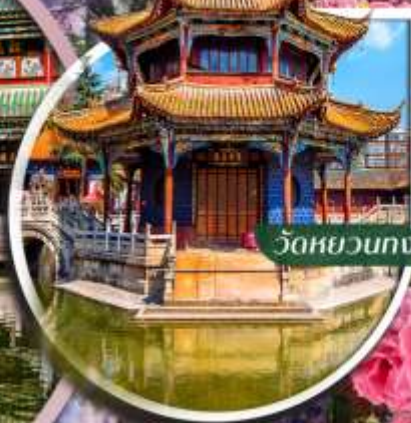
วังหววนทง