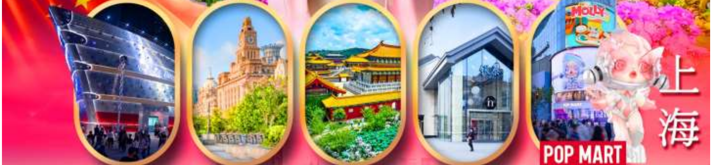
เรือคะหลุยส์