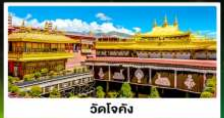
วัดโจกัง