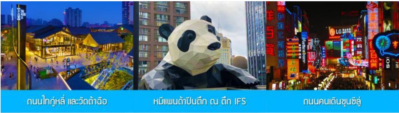
ถนนไท่กุ่หลี่ และวัดต้าฉือ

พักที่ โรงแรม MULIAN ZHUANG HOTEL ระดับ 4 ดาวท้องถิ่น หรือเทียบเท่าในเฉิงตู