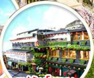
หมู่บ้านโบราณ จิวเฟิน