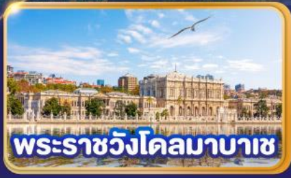
พระราชวังโดลมาบาซ