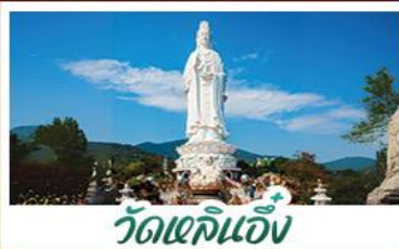
วัดเข้ก๊อ้ง