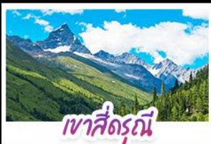
เขาสี่ดรุณี