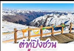
ต้ากู่ปิงชวณ