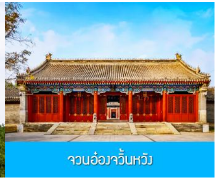
จวนอ๋องจวินหวัง

วันที่หก เมืองเออร์ดอส -อี้เค่ออ่าเปา-พิพิธภัณฑ์เครื่องเงิน-จวนอ๋องจวินหวัง- สวนวัฒนธรรมหมงกู่หยวน หลิว-ซื้อปิ้งถนคนเดิน -บินกลับกรุงเทพฯ