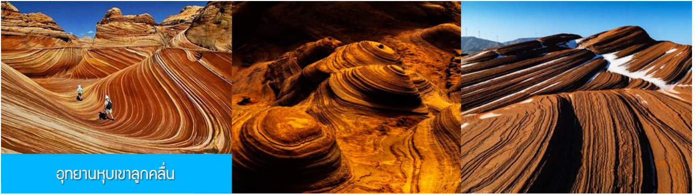
อุทยานหุบเขาลูกคลื่น