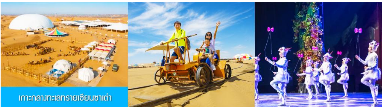
เกาะกลางทะเลทรายเซียนซาเต๋า