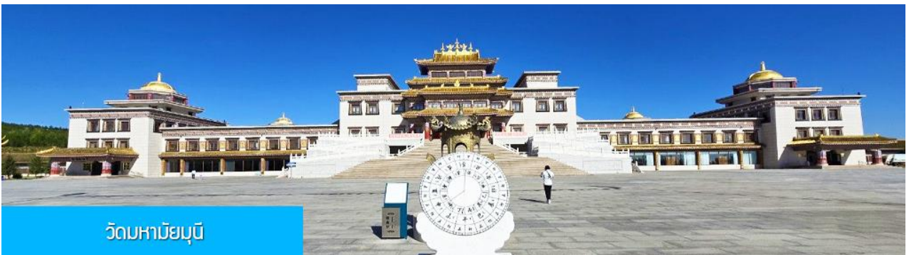
วัดมหายมุนี

พักที่ YULIN CHAOYANG INTER HOTEL โรงแรมระดับ 4 ดาวท้องถิ่น หรือเทียบเท่าในเมืองหยี่หลิน