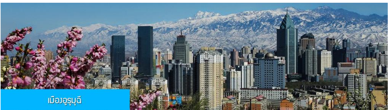
เมืองอูรูมูดี

พักที่ MERCURE HOTEL โรงแรมระดับ 4 ดาวท้องถิ่นหรือเทียบเท่าในเมืองวูรูมูดี