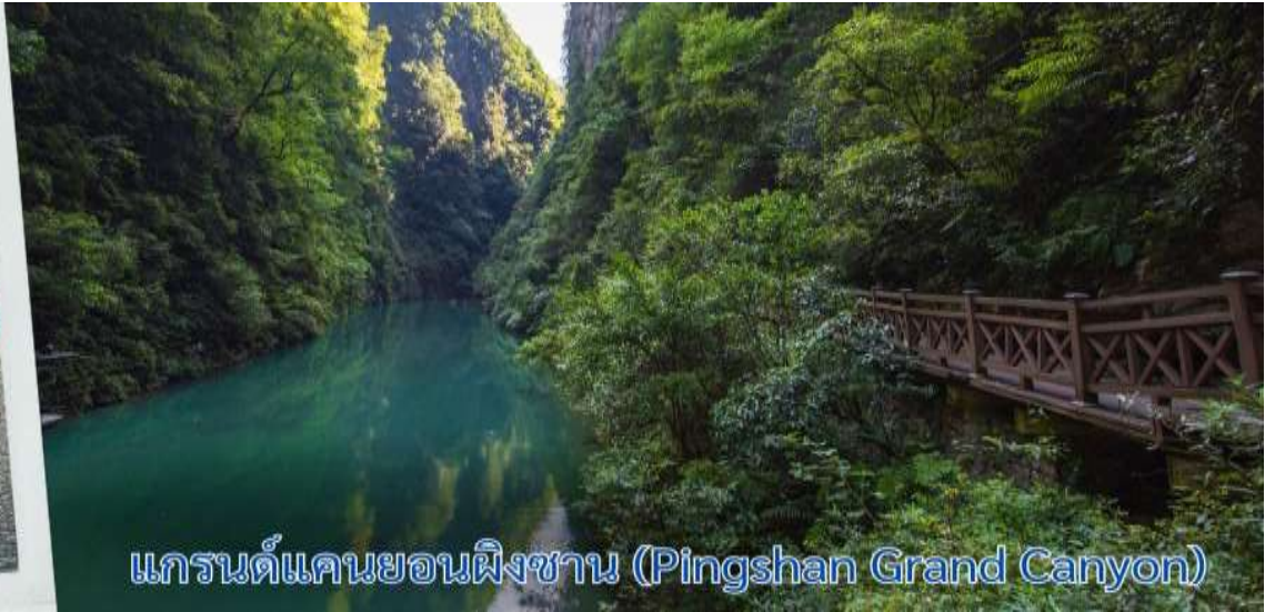
แกรนด์แคนยอนผิงซาน (Pingshan Grand Canyon)