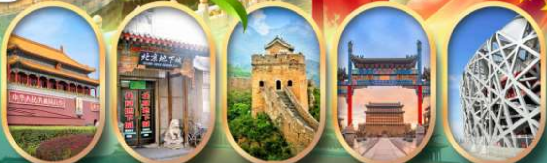
จัตุรัสเทียนอันเหมิน เมืองโบราณใต้ดิน กำแพงเมืองจีน ถนนคนเดินเทียนเหมิน ผ่านชมสนามกีฬาาริงนก