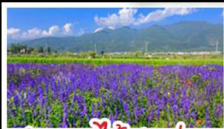
สวนดอกไม้ฮาวอวูมี๋ฉ่าง