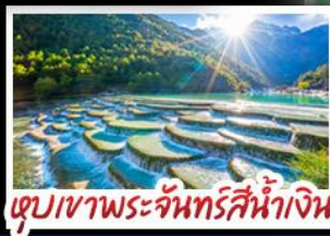
ตูปเขาพระจันทร์สีน้ำเงิน