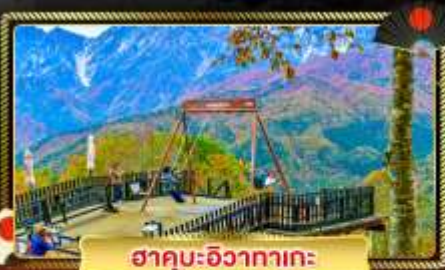
ฮาคุบะอิซากาตะ