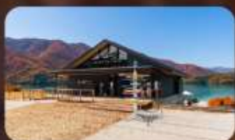
AO Lakeside Cafe 1

HOTEL NARITA AREA หรือเทียบเท่ามาตรฐานญี่ปุ่น