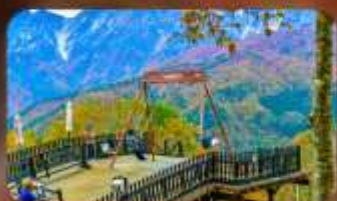
ฮาคุบะ-อิวาซากะ