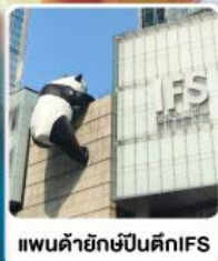
แพนด้ายักษ์ปีนตึกIFS