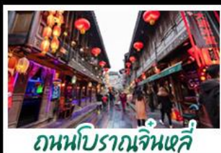
ถนนโบราณจินหลี่