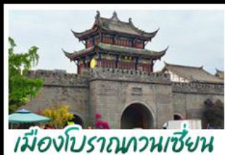
เมืองโบราณทวนเซี่ยน

ภูเขาสี่ดรุณี - อุทยานปี้เฉิงโกว - สะพานหนานเฉียว - ร้านหนังสือจงซูเก๋ - เมืองโบราณกวนเสียน จตุรัสเทียนหู่ - หมู่แพนด้าซาฟี่ - ถนนโบราณชอยกว้างชอยแคบ - ถนนคนเดินไท่กูหลี่ ถนนคนเดินซุนซี - ถนนโบราณจินหลี่ - แพนด้ายักษ์ปิงตึก - น้ำพุไม้ไผ่ตึกSKP - วัดต้าฉือ