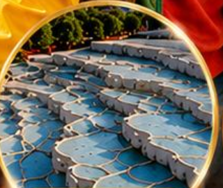
ปามุกคาล่า Pamukkale