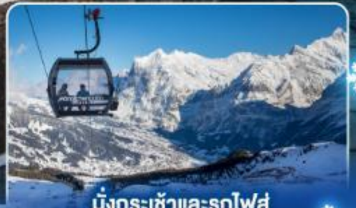
นั่งกระเช้าและรถไฟสุด อลเวงจากจุงเฟรา