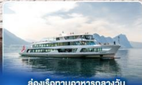
ล่องเรือทานอาหารกลางวัน ทะเลสาบลูเซิร์น