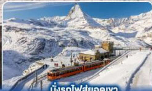
นั่งรถไฟสุดอลเวง กรอนเนอร์เกรต