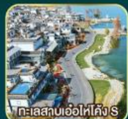
ทะเลสาบเอ๋อไห่คิง S