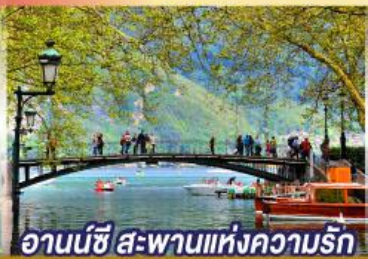
อานนีซี สะพานแห่งความรัก